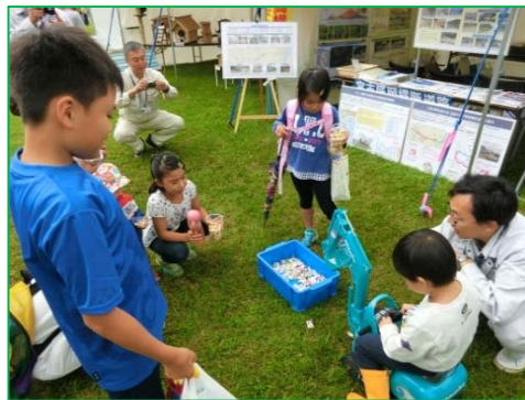
飴すくいゲームで楽しむ子供たち