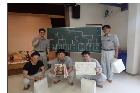
賞状・優勝トロフィーと共に 記念撮影

箱石地区道路工事（安藤・間JV）では、昨年に引き続き、箱石地区対抗ゲートボール大会に参戦しました。昨年は残念ながら一回戦敗退でしたが、今年は若手を投入した結果初優勝と成りました。大会終了後には懇親会があるなど楽しい一日と成りました。