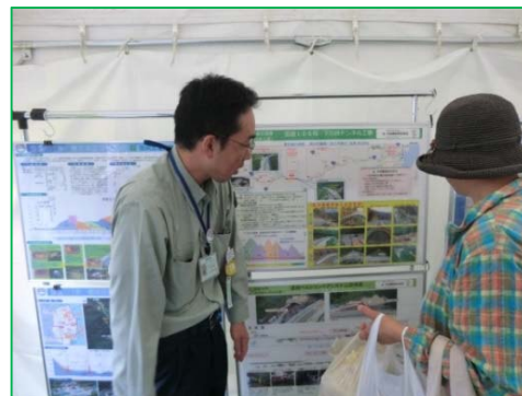
パネルで工事の進捗状況を見ていただきました。