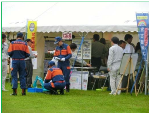
大盛況の展示ブース

当日はあいにくの雨模様でしたが、多くの方々に参加いただきました。特に好評だったのが、バックホウによる『飴すくいゲーム』で、子供から大人まで楽しんでいただきました。また、来場された方々からは「横断道路はいつ頃完成するのですか」といった質問が多く、早期完成への期待の大きさが伝わってきました。