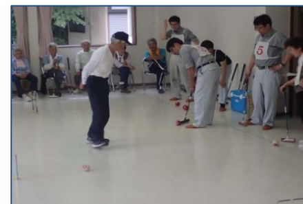
大会風景 みんな真剣です！！