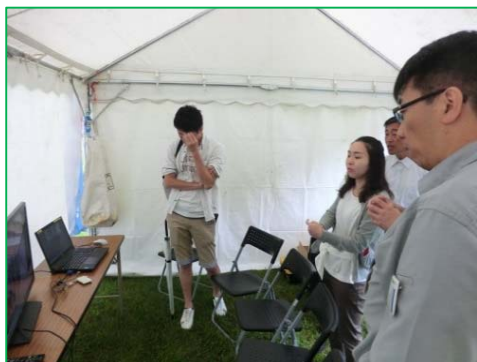
トンネルがどのように作られていくのかを動画で見させていただきました。